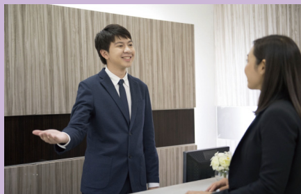
サービスカウンター・受付