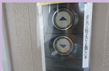
エレベーター・自動ドアスイッチ