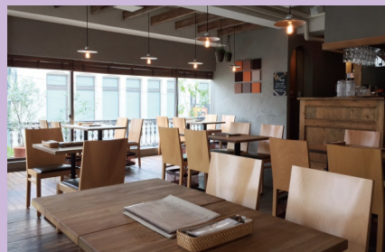
食堂・フードコート