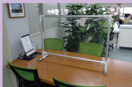
オフィス商談スペース