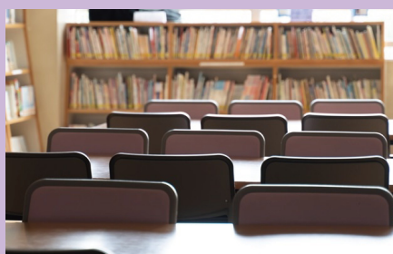
図書館・博物館等公共施設