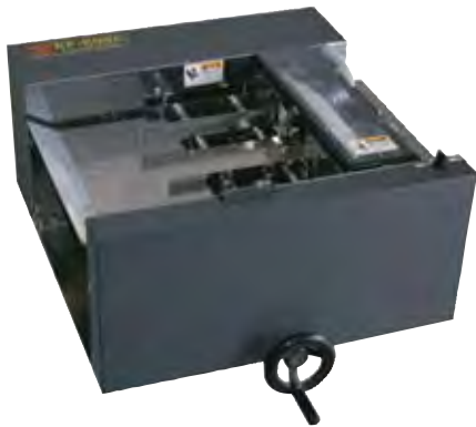
エレベーターエアフィーダー EF-500A エレベーターフィーダー EF-500